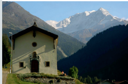
Die Kapelle St-Etienne in Liddes

Nach dem Wildbach Allèves befand sich das gleichnamige Dorf. Es wurde verlassen, als um 1850 die Kutschenstrasse gebaut wurde; heute ist nichts mehr davon übrig. Der Verkehr ging weiter oben am Hang durch, die Wirtschaft ging zugrunde, und die Bewohner verliessen nach und nach den Ort. Nach dem Lawinenschutzunnel und der Kapelle Notre-Dame de Lorette kommt der historische Weg in Bourg-St-Pierre an.