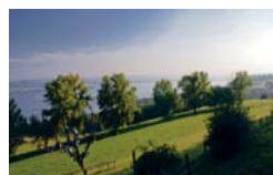
Grandioser Blick vom Mont Vully

hen) sollte sie sichern. Aus den nachfolgenden Jahren stammen ebenfalls die meisten der auf Grund von Bruchstücken sich vorstellbaren öffentlichen Gebäude. Die damaligen Wohn- und Handwerkerhäuser hingegen liegen unter den Fundamenten neuzeitlicher Bauten. Auch die Kanalisationen, die Aquädukte (total sieben sollen es gewesen sein) sowie die Strassen liegen leider zum allergrössten Teil unter dem Staub und Schutt der Jahrhunderte begraben. Zu besichtigen sind hingegen das Osttor , das Amphitheater , in dem die Kultur wieder neu aufblühte, Ruinen des Theaters , der Thermen , des Tempels der Grange des Dimes sowie des Cigognier -Heiligtums, so genannt, weil auf der letzten der ursprünglich 16 rund 20 m hohen Kalksteinsäulen Jahr für Jahr die Störche brüteten. Eines bleibt dieser Aufzählung von historischen Sehenswürdigkeiten noch anzufügen, der sensationelle Fund vom 19. April 1939 nämlich, als eine Gruppe von Arbeitslosen aus