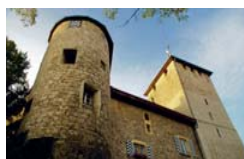
Murten: wehrhaftes Städtchen

Lausanne, die hier eine temporäre Anstellung fanden, bei Grabarbeiten in einem ehemaligen römischen Kanal eine Büste fanden – völlig intakt, 33,5 cm hoch, also zirka zwei Drittel natürlicher Grösse, in Repoussé-Technik gefertigt (innen hohl), fast 1,6 kg schwer und aus 22-karätigem Gold. Das Konterfei des bärtigen, kurzhaarigen Mannes im Schuppenpanzer und Prunkmantel wurde Kaiser Mark Aurel zugeschrieben. Aber diese These ist umstritten ... Doch es ist höchste Zeit, aus der Antike wieder in die Gegenwart zurückzukehren. Avenches verlassend, wandern wir, den Teiche überquerend, zum Lac de Morat (Murtensee), gelangen ihn entlang nach Salavaux mit dem beliebten Campingplatz, überqueren die Broye und steigen durch die Rebberge nach Vallamand-Dessus hinauf. Zurückblickend in Richtung Avenches, bedauern wir noch einmal, dass die einfallenden Alemannen um 276/277 n. Chr. das blühende Aventicum weitgehend zerstört haben.