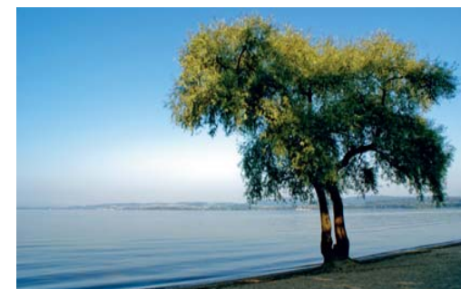
Salavaux Plage: wo einst römische Lastkähne Segel setzten

Der Blick durch die Rebstöcke hinter auf den blauen Lac de Morat, dahinter die grünen Hügel des Fribourgerlandes und die schneebedeckte Alpenkette, ist fantastisch. Und eine andere Aussicht, die sich uns in Vallamand-Dessus eröffnet, ist dies ebenso – jene auf die gastronomischen Spezialitäten des Vully nämlich. Ein lebensfreudiger Romand hat einmal gesagt: «Le Vully, ça se mange et se bois!» Also zumindest ein Stück des berühmten Vully-Kuchens sowie ein Schlüchchen des lokalen Weins , ob blanc, rosé oder rouge, gehören sozusagen zur guten Pflicht eines Besuchs der Region. Ob hier erfüllt oder in Lugnorre, das wir via Le Terre und über die weiten Felder des Vully erreichen. In Lugnorre beginnt der eigentliche Aufstieg auf den Mont Vully . Von der Zeit der Helvetier bis zu den letzten Weltkriegen galt der Berg als «Koloss» der Verteidigung des Landes. Entsprechend vielfältig sind deshalb die historischen Spuren und Überreste, die es – je nach Wegwahl – zu entdecken gibt. So zum Beispiel die verschiedenen Stützpunkte, Beobachtungsposten, Unterstände und unterirdischen Gänge der Kasematten (1914–1918), der Alarmfeuerplatz des alten Staa-