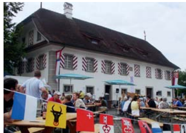
Sust bei Stansstad

Am Ende der Etappe ist ein Besuch des Klosters in Engelberg ein Muss. Nebst der eindrücklichen Kirche lohnt sich auch die Besichtigung der Schaukäserei und des Klosterkellers, in dem zu Zeiten der Säumerei der italienische Wein gelagert wurde. Der damals gegen den Sbrinz eingetauschte Wein soll für die Region eine bedeutende wirtschaftliche Grundlage gewesen sein.