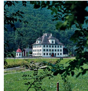
Herrenhaus in Grafenort