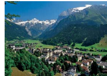
Hochtal von Engelberg