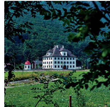
Maison de maître à Grafenort