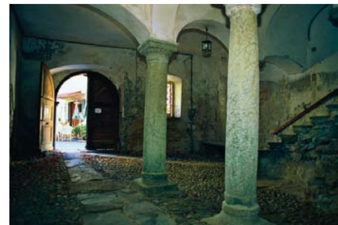
Alte Hauseinfahrt in Thisis