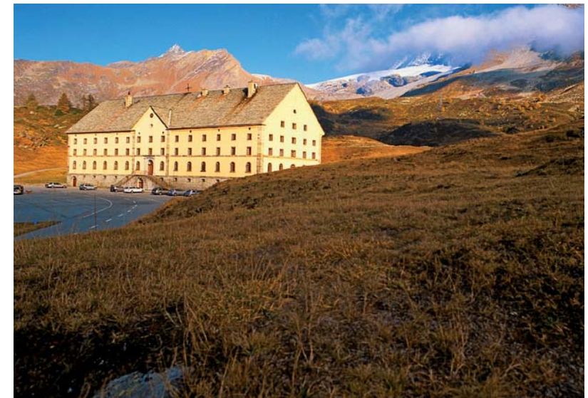
L'Hospice sur le col du Simplon

le massif hospice géré depuis son ouverture en 1831 par des moines du Grand St-Bernard et, un kilomètre au sud du col, l'« Alter Spittel » de Stockalper, qui était à la fois un poste de transbordement pour les porteurs, un lieu d'hébergement pour les voyageurs