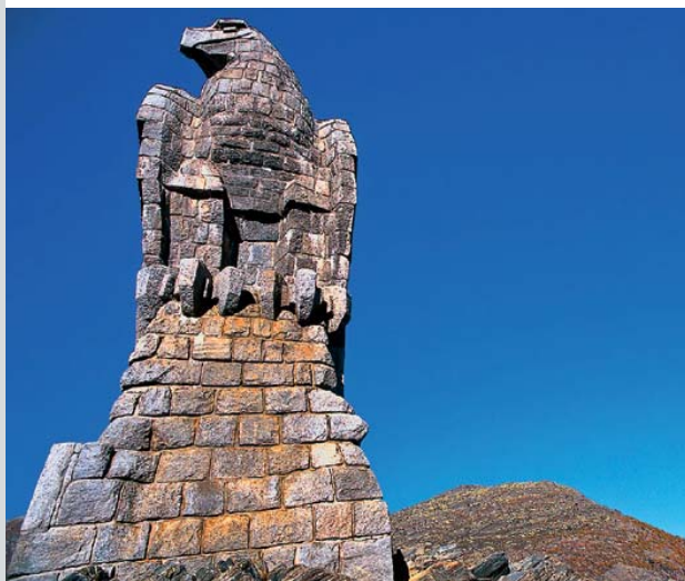
Aigle du col du Simplon

Visites guidées de mai à octobre tous les jours sauf le lundi : 09h30, 10h30, 13h30, 14h30, 15h30, 16h30