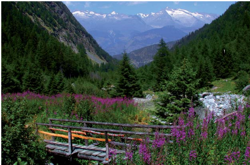
Vue sur le Tafernatal en direction du nord

dessus de Brigue presque face à la pente et évite les gorges de la Saltina sur un tronçon spectaculaire directement au-dessus du vide. De nombreux murs de protection et des passages pavés ont subsisté et on peut imaginer à quel point la construction de ce chemin a dû être périlleuse à l'époque de Stockalper.