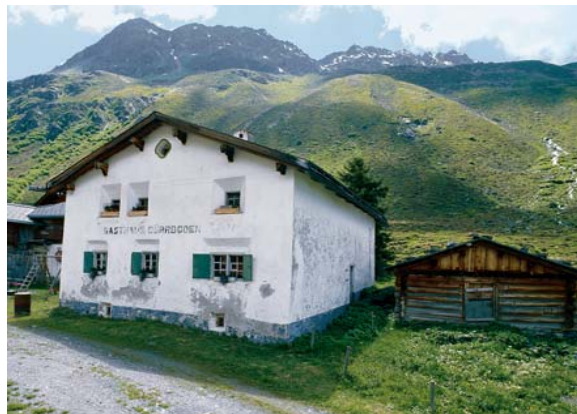
Das Alte Gasthaus in Dürrboden

Die dritte Etappe der ViaValtellina verbindet Davos über den Scalettapass mit dem Engadin. Vom turbulenten, urbanen Davos geht es südwärts durch das beschauliche Dischmatal. Grösstenteils auf dem historischen Saumweg erreichen wir auf einer Wanderung durch Streusiedlungen und vorbei an saftigen Bergweiden Dürrboden, den letzten Ort vor dem Aufstieg zum Scalettapass. Von der Passhöhe, dem höchsten Punkt der ViaValtellina, folgt der Abstieg zur Alp Funtauna und durch das stille Val Susauna nach S-chanf, im Engadiner Haupttal.