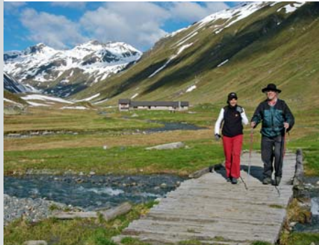
Alp Funtauna südlich des Scalettapasses

Die dritte Etappe der ViaValtellina verbindet Davos über den Scalettapass mit dem Engadin. Vom turbulenten, urbanen Davos geht es südwärts durch das beschauliche Dischmatal. Grösstenteils auf dem historischen Saumweg erreichen wir auf einer Wanderung durch Streusiedlungen und vorbei an saftigen Bergweiden Dürrboden, den letzten Ort vor dem Aufstieg zum Scalettapass. Von der Passhöhe, dem höchsten Punkt der ViaValtellina, folgt der Abstieg zur Alp Funtauna und durch das stille Val Susauna nach S-chanf, im Engadiner Haupttal.