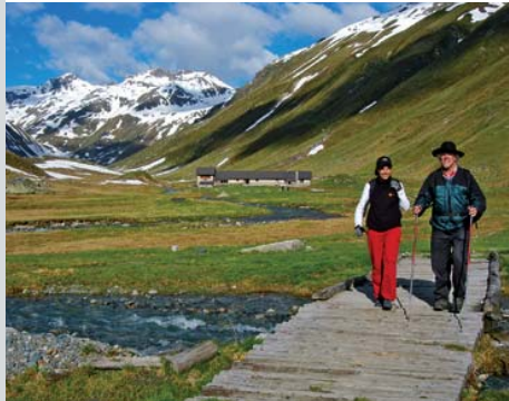
Alp Funtauna au sud du Scalettapass

Cette étape de la ViaValtellina relie Davos à l'Engadine par le Scalettapass. Depuis Davos turbulente et citadine, on part en direction du sud à travers la vallée de Dischma. En suivant la plupart du temps le sentier historique, on marche à travers des groupes de maisons dispersées et on passe vers Dürrboden, un alpage de montagne verdoyant, dernier endroit habité avant la montée au Scalettapass. Au col, le point culminant de la ViaValtellina , on redescend sur l'Alp Funtauna à travers le calme Val Susauna jusqu'à S-chanf, dans la vallée principale de l'Engadine.