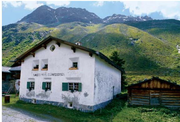
L'auberge Alte Gasthaus à Dürrboden

Cette étape de la ViaValtellina relie Davos à l'Engadine par le Scalettapass. Depuis Davos turbulente et citadine, on part en direction du sud à travers la vallée de Dischma. En suivant la plupart du temps le sentier historique, on marche à travers des groupes de maisons dispersées et on passe vers Dürrboden, un alpage de montagne verdoyant, dernier endroit habité avant la montée au Scalettapass. Au col, le point culminant de la ViaValtellina , on redescend sur l'Alp Funtauna à travers le calme Val Susauna jusqu'à S-chanf, dans la vallée principale de l'Engadine.