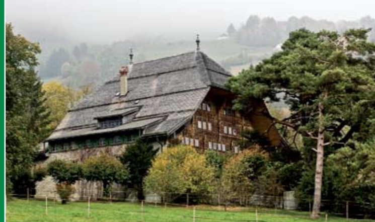
▶ Rossinière: la réussite d'un marchand de fromages et le Grand Chalet... de Balthus

Deux forfaits plongent le visiteur dans le parcours de ces marchands, leur commerce de meules de fromage. Du lac Léman, et de Montreux, à l'origine du tourisme contemporain, on franchit le col de Jaman pour découvrir la Gruyère et le Pays-d'Enhaut aux sources du Gruyère AOC et de L'Étivaz AOC, première appellation d'origine contrôlée enregistrée en Suisse.