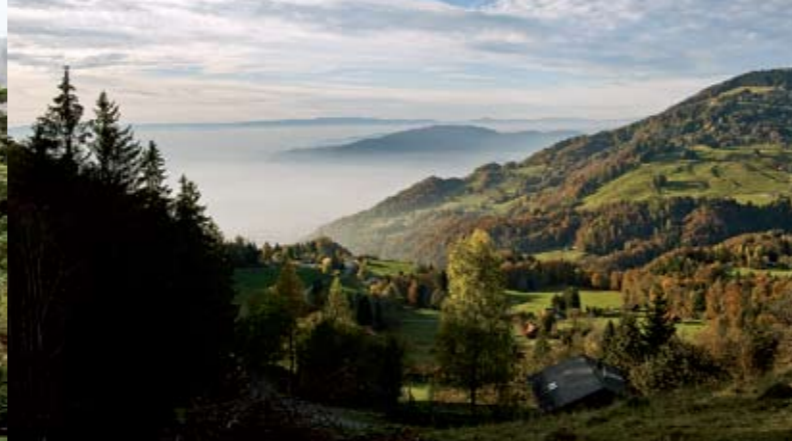
▶ Les Avants : coup d'œil imprenable sur le lac Léman

Marche jusqu'aux Allières par le col de Jaman (1512m) (3h10). Découverte de l' ancien chemin muletier que parcouraient les marchands de fromage, nombreuses traces de l'ancien chemin visibles sur le versant nord du col. Repas de midi aux Allières. Descente sur Montbovon. Temps de marche : 4h40. Dénivelé : + 623m / - 795m. Repas et nuitée à Montbovon.