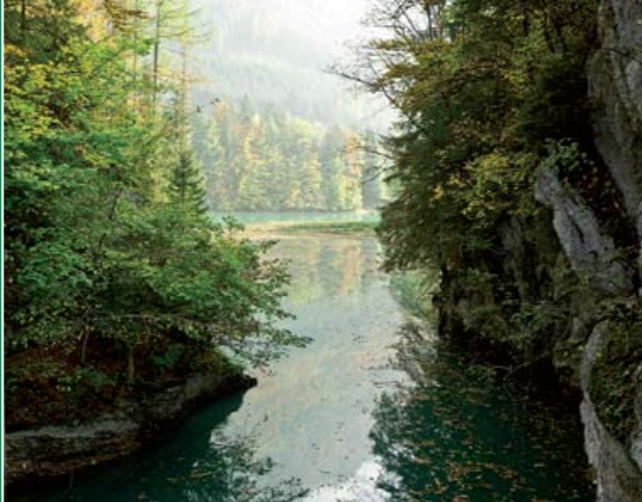
La Sarine et ses falaises à Lessoc

Offre valable de juin à octobre. En dehors de ces dates, prière de se renseigner auprès des centrales de réservation.