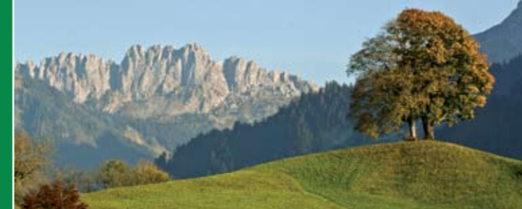
▶ Charmey, l'arrivée avec les majestueuses Gastlosen