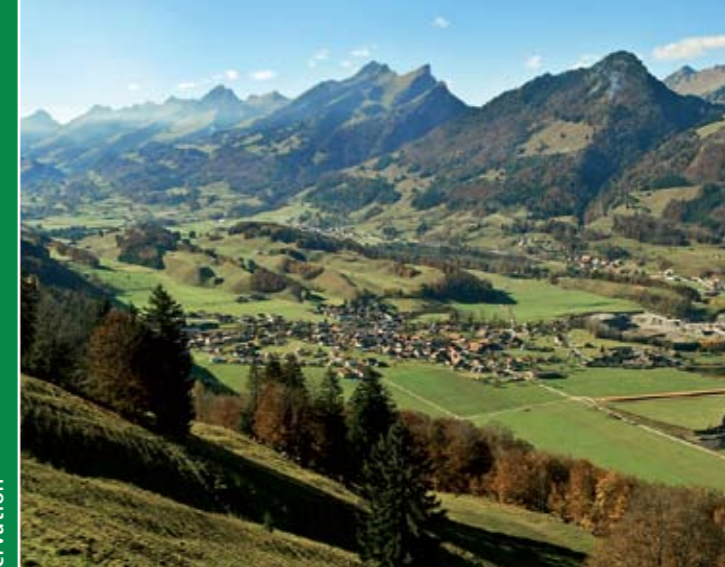
L'Intyamont, ses montagnes et ses villages

Le prix du billet de retour depuis L'Étivaz ou Charmey est compris dans le forfait, il permet de rejoindre Montreux par le car et le train.