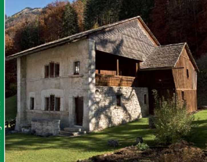
Grandvillard, la maison du banneret, la réussite d'un marchand de fromages

Offre valable de juin à octobre. En dehors de ces dates, prière de se renseigner auprès des centrales de réservation.