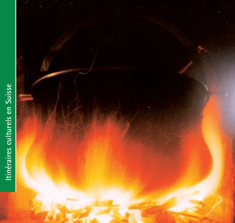
Le fromage d'alpage: le retour aux sources

Itinéraires culturels en Suisse : cette appellation désigne une façon totalement nouvelle de découvrir le paysage culturel de la Suisse et de ses régions voisines. Randonner sans souci, manger avec délice, boire avec plaisir, dormir dans des endroits de choix et découvrir les beautés du pays avec tous nos sens.