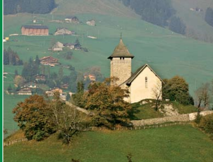
Château-d'Oex: le temple et sa colline