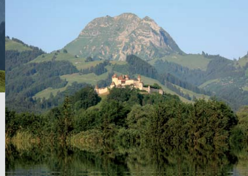
▶ Le Moléson veille sur le château de Gruyères

Marche dans le Haut-Intyamont jusqu'à Grandvillard par le pont couvert et le village de Lessoc (1h45). À ne pas manquer la grotte et la cascade de Grandvillard où l'on prendra le repas de midi. L'après-midi découverte du sentier agro-sylvicole le long de la Sarine et montée à Gruyères par Saussivue et la Charrière des morts (2h00). Visite de la Maison du Gruyère à Pringy. Temps de marche : 3h45. Dénivelé : + 312m / - 306 m. Repas et nuitée à Gruyères.