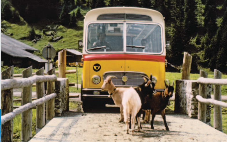
◀ La vecchia strada del Grimsel a Chüenzentennen ▶ Autopostale tipo FBW PCUA, anni 1960

Strade ripide, curve strette, la triade del corno postale ed un abile autista dell'autopostale – sulla ViaPostaAlpina si toccano con mano oltre 160 anni di storia dell'«Istituzione» Posta alpina. Una buona porzione di romanticismo, un pizzico di mito, momenti fortunati e svolte sorprendenti: tutti ingredienti per un delizioso viaggio. Benvenuti sulla ViaPostaAlpina!