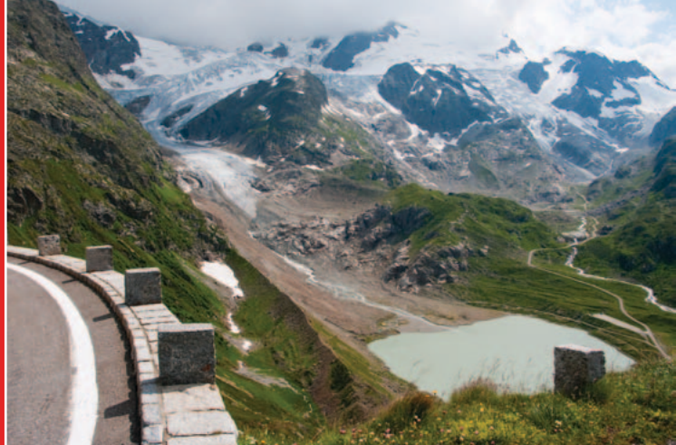
▲ Strada panoramica sul Susten, costruita nel 1947

Autopostale Ulrichen, Abzw. Nufenen–Nufenen Passhöhe (33 min.) Escursione Passo della Novena–Airolo: 5 ore 45 min., 22 km La ripida salita sulla strada carrozzabile del XX secolo è percorsa facilmente dall'autopostale. Al Passo della Novena comincia una facile escursione panoramica attraverso la Valle Bedretto.