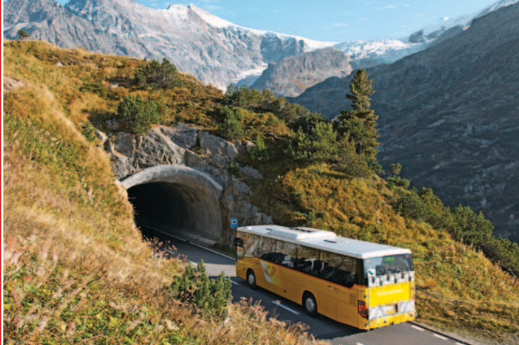
▲ Tunnel sopra Stein, al Passo del Susten