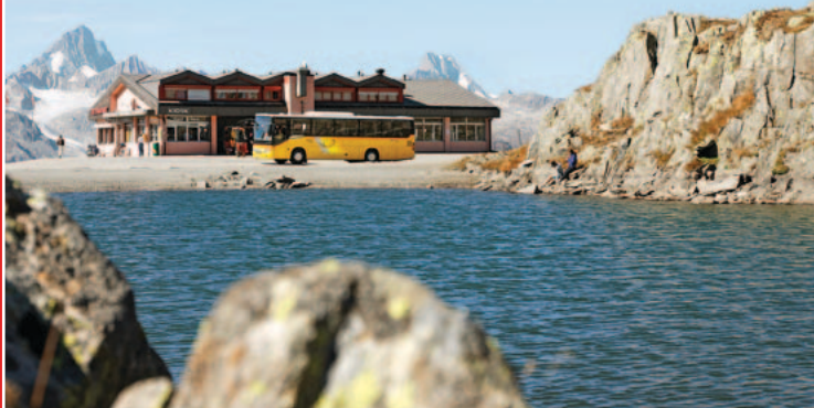
▲ Strada sul Passo della Novena

La ViaPostaAlpina parte da Meiringen e ritorna al punto di partenza in sei tappe attraversando i passi del Grimsel, della Novena, del San Gottardo e del Susten. Questo percorso può essere fatto interamente a piedi o con l'autopostale. Oltre alle combinazioni di viaggio in torpedone e a piedi, sono possibili tante altre soluzioni.