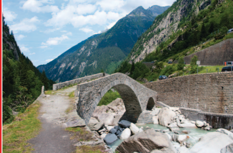
▲ Il ponte di Häderli nella gola di Schöllenen