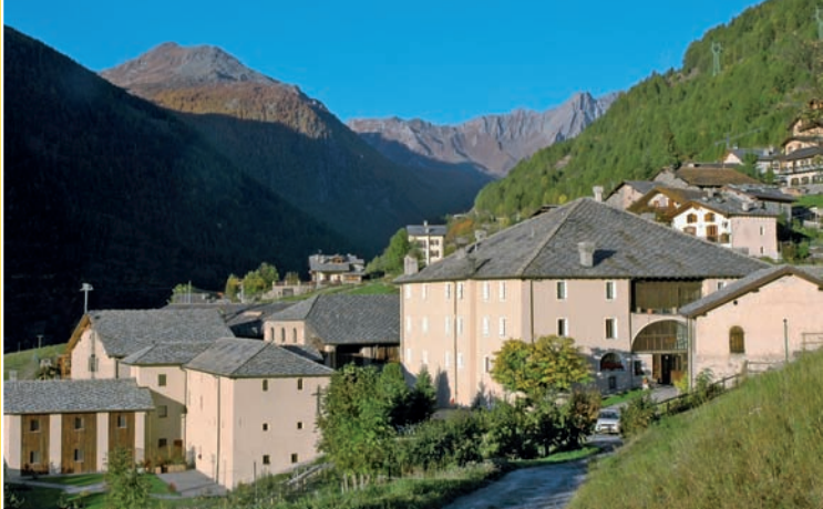
▲ St-Oyen (I), château Verdun