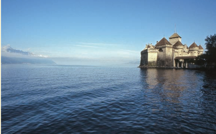
▲ Château de Chillon