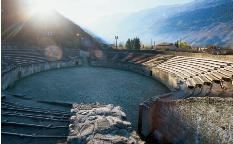
▲ Martigny, amphithéâtre

Etape 8: Aigle – Massongex – St-Maurice 5h15, 18 km L'itinéraire passe par Ollon puis rejoint Saint-Maurice en longeant le Rhône qu'il traverse à Massongex.