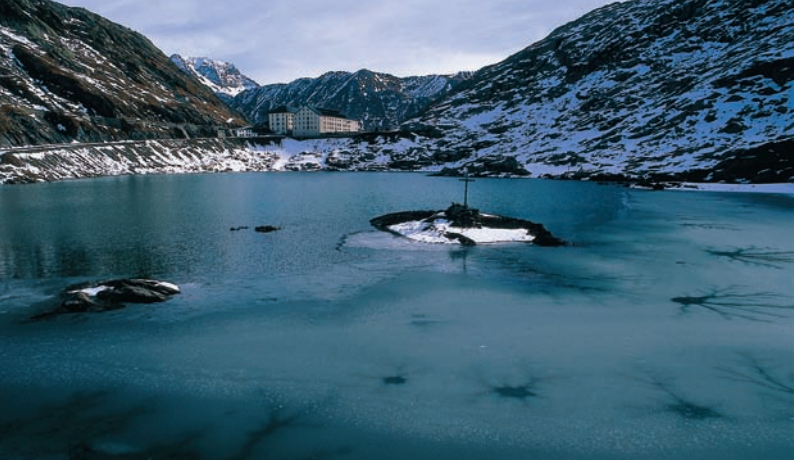
▲ Grand-Saint-Bernard, lac et hospice