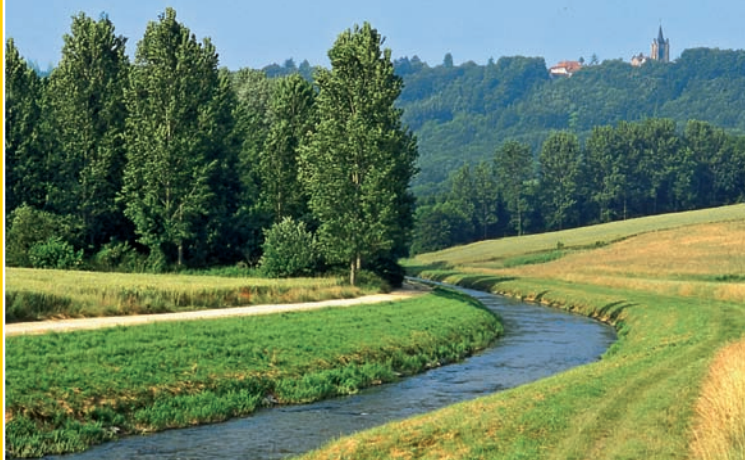
▲ La Venoge près de Lusseray