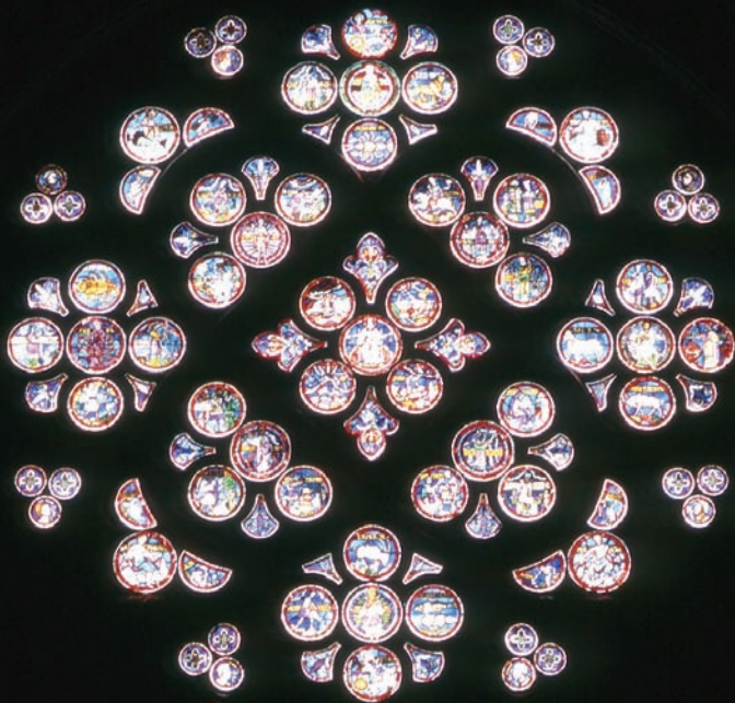
▲ Chemin près de Liddes