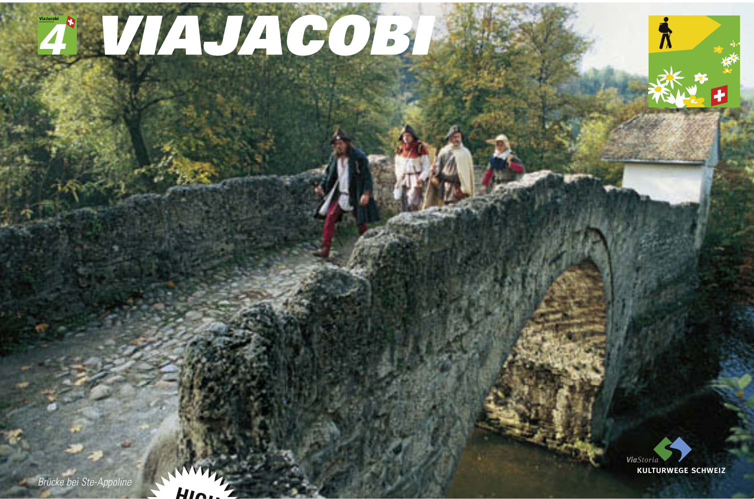
Brücke bei Ste-Appoline