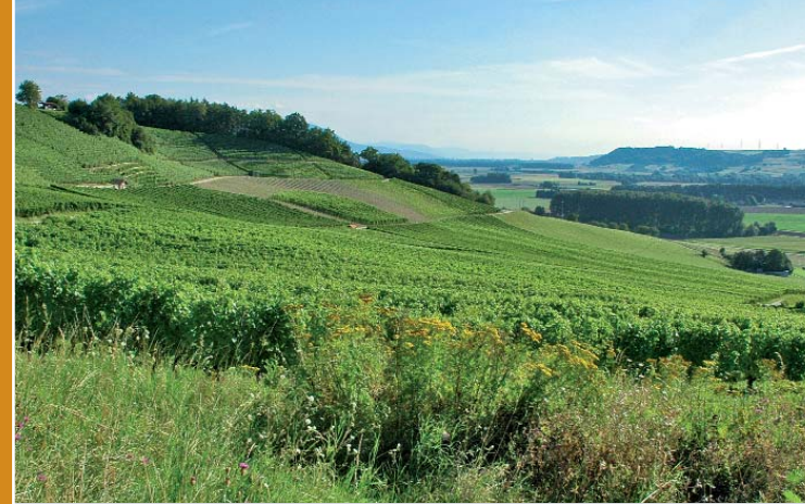
▶ Orbe, Creux de Villars

Die Begeisterung für die römerzeitliche Bautechnik und Kultur ist ungebrochen. Die ViaRomana führt Sie auf den Spuren der Handelsreisenden, Legionäre und Kaiserfamilien zu Fuss, mit der Bahn, mit Bus und Schiff durch die römische Schweiz. Die Reise auf dem südlichen Teil der ViaRomana können Sie als Package buchen. Dabei folgen Sie dem antiken Verkehrsweg von Genf über Lausanne und Yverdon-les-Bains bis nach Avenches, der Hauptstadt der Helvetier.