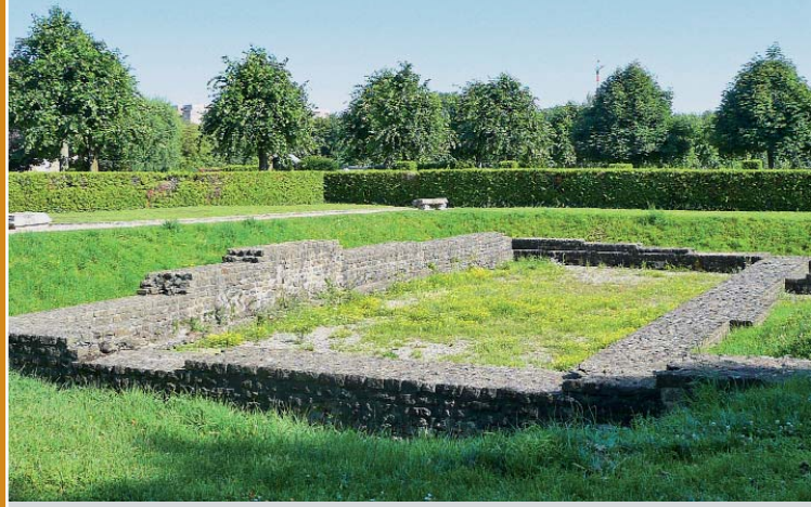
▲ Yverdon-les-Bains, Castrum