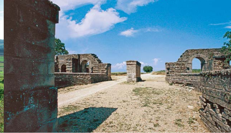
▶ Avenches, Osttor