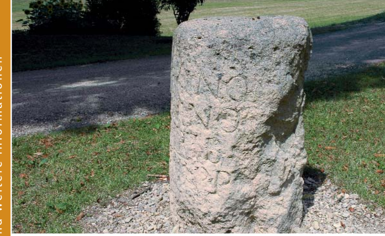
▲ Enteroches, Meilenstein