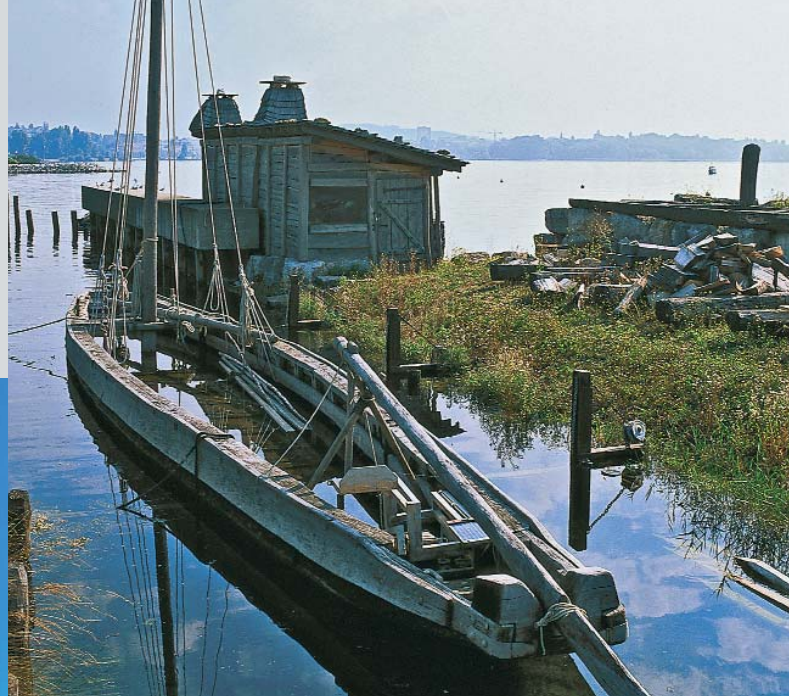
◀ Nyon, Platz der Kastanienbäume