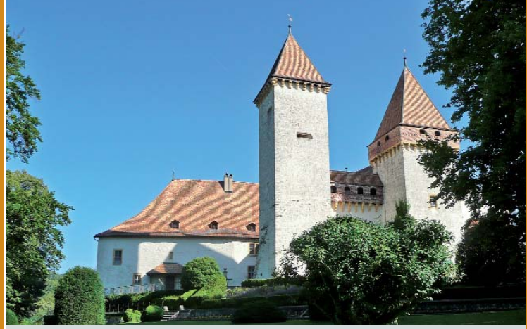
▲ La Sarraz, Schloss

Vorbehalte Programm- und Preisänderungen bleiben vorbehalten.