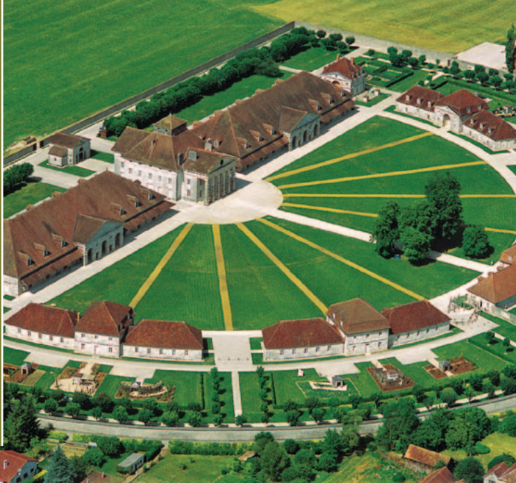
▲ Arc-et-Senans, Saline Royale