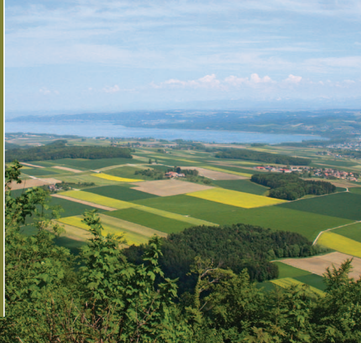
▲ Vue panoramique sur le lac de Neuchâtel