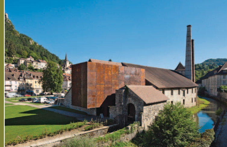
▲ Salines de Salins-les-Bains