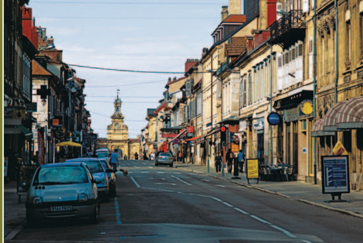
▲ Pontarlier, Rue République