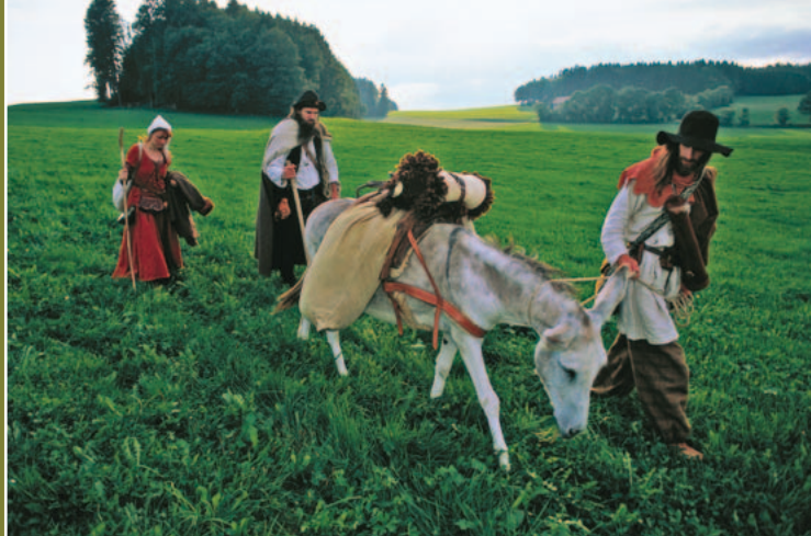
▲ Contrebandiers du sel