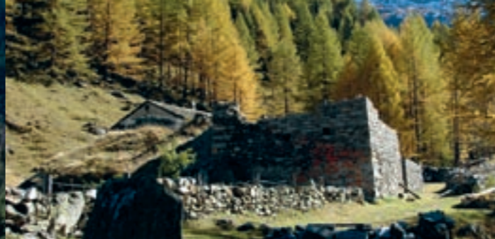
In der Taferna beim ehemaligen Gasthaus

Nachdem Stockalper zunächst ein von seinem Urgrossvater 1533 erbautes repräsentatives Haus renovieren und durch einen Saalbau mit vorgelagerten Laufgängen, einer Kapelle und einem geschlossenen kleinen Hof erweitern liess, gab er in den 50er Jahren den eigentlichen Palastbau in Arbeit. Zwanzig lange Jahre wurde an dem vom Keller bis zum First acht Geschosse zählenden Stockalperschloss mit den drei von Zwiebelkuppeln gekrönten, hochragenden Türmen und dem grosszügig angelegten Arkadenhof gebaut. Während der Palast