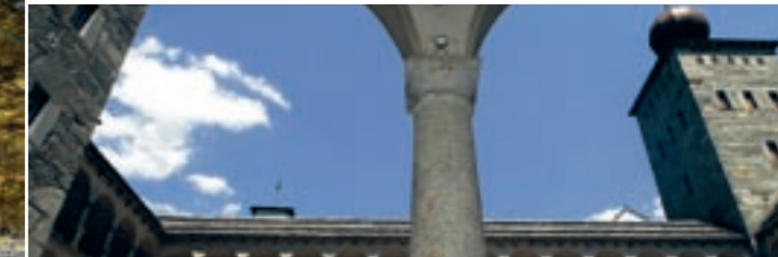
Arkadenhof des Stockalperpalastes

Auen gehören zu den dynamischsten Lebensräumen. Diese teilweise unberechenbare Dynamik ist es auch, die in unserer gezähmten Umwelt nur noch wenig Platz erhält. Durch Kanalisation der Fließgewässer sind 90 % der Schweizer Auen verschwunden. Erst vor wenigen Jahren wurde die Bedeutung der wenigen noch übrig gebliebenen Auengebiete thematisiert. Das heutige Idealbild der Umweltpolitik