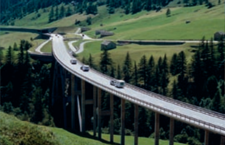
N9 unterhalb von Simplon Dorf

Der Schaden durch den «Gletschersturz» traf die Bevölkerung von Simplon hart: 67 ha Wiesen und Weiden waren mit Schutt bedeckt, die lichten Waldbestände an den Hängen umgeworfen, 38 Gebäude zerstört, 13 Stück Grossvieh und 40 Stück Kleinvieh waren verloren und zwei Frauen kamen auf dem Wege zur Besorgung ihrer Tiere ums Leben. Im Bereich der Napoleonstrasse betrug die Überschlüttung zwischen drei und vier