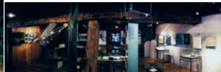
Ausstellung im «Alten Gasthof» in Simplon Dorf

Der Gebäudekomplex wurde in mehreren Bauetappen zwischen dem 14. und 18. Jh. errichtet. Der giebelständig zum Platz stehende Hauptteil der Sust ist auf 1611 datiert. Bauarchäologische Untersuchungen haben aber ergeben, dass Teile eines Vorläuferbaus aus dem 14. Jh. in der erhaltenen Bausubstanz integriert sind. Erweiterungsbauten erfolgten im späteren 17. und im 18. Jh. Wie verschiedene andere Bauten in Simplon Dorf sind auch die Blockwände des «Alten Gasthofs» im Zuge von Erweiterungen nachträglich mit Mantelmauern versehen worden. Dadurch erhält das Gebäude den Habi-