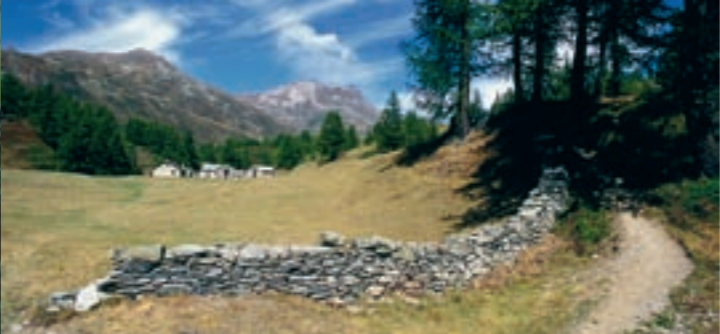
Stockalperweg beim Alpstafel Niwe

In Simplon Dorf haben die alten, dem überlokalen Transportwesen dienenden Strassenführungen Geschichte und Anlage des Dorfes weitgehend bestimmt. F. O. Wolf schreibt im Jahre 1888 von seinen Wanderungen durchs Wallis: «Je ärmer die Hochtäler an Vegetation und an eigenen Produkten waren, um so reicher wurden sie nun durch den Transithandel, (...) da entstanden wohlhabende Dörfer, so besonders in den Schluchten des Simplonweges.» Das Dorf Simplon war im Mittelalter nördlich der napoleonischen Strasse um den Platz bei der Kirche und längs