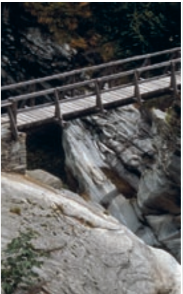
Holzstege des Stockalperweges im Zwischbergental

Bis ins 20. Jh. war das Zwischbergental Hauptwohngebiet der Gemeinde Gondo-Zwischbergen. Das landwirtschaftlich nutzbare Land lag fast ausschliesslich in diesem Tal und die Gemeinde war stark bäuerlich geprägt. Die grosse